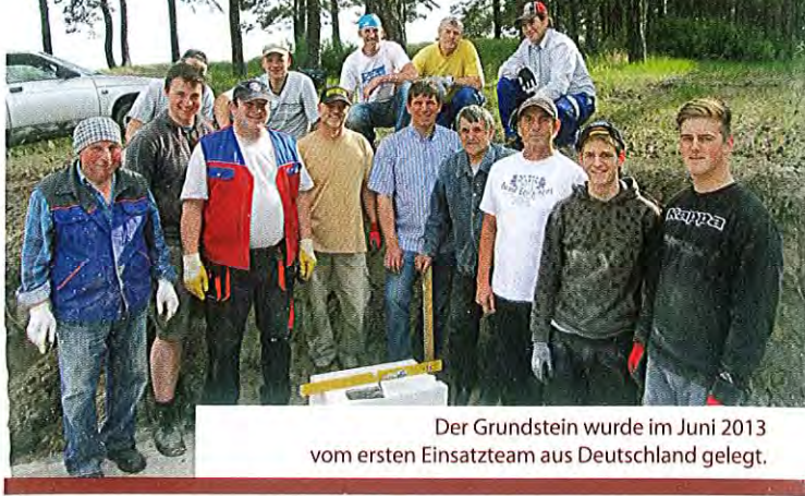
Der Grundstein wurde im Juni 2013 vom ersten Einsatzteam aus Deutschland gelegt.